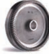
Yarı Kapasite Fanı Half Flow Impeller