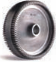
Tam Kapasite Fanı Full Flow Impeller